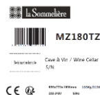
Exemple d'étiquette du carton

Vous recevrez au plus tard le 30/11/2021 et après réception de votre dossier conforme, votre remboursement. Pour toute question à propos de l'offre vous pouvez nous contacter à contact@lasommeliere.com